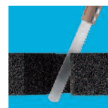
Gemakkelijk te verwerken