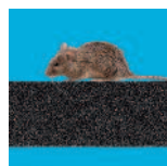
Bestand tegen ongedierte